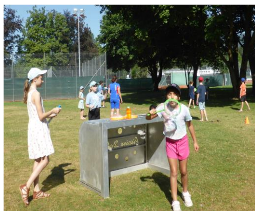
Journée Kids et jeunesse en juin